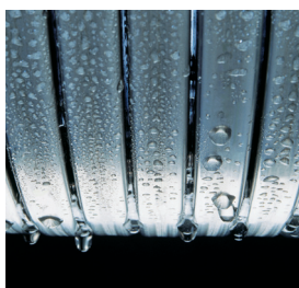
Поверхность теплообмена Inox-Radial

Газовый конденсационный котел Vitodens 200-W - эффективное и недорогое решение в диапазоне тепловой мощности от 4,8 до 105 кВт.