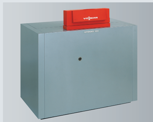
Vitogas 100-F – низкотемпературный газовый водогрейный котел мощностью от 72 до 140 кВт