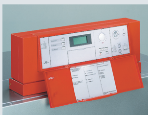
Цифровой регулятор котлового контура Vitotronic 300 GW 2