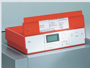
Цифровой регулятор котлового контура Vitotronic 200 KW 5