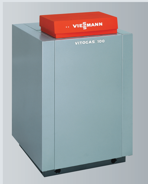
Vitogas 100-F – низкотемпературный газовый водогрейный котел мощностью от 29 до 60 кВт